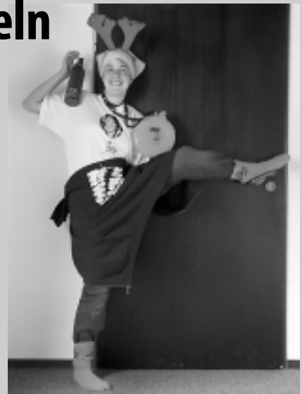
KJG-Style in full effect: Top-Supermodell Naomi Klum auf der Prêt a Porter der Diözesanverbände.

Die Don'ts für diesen Sommer: Batik, Poloshirts und vor allem: das Hemd in die Hose stopfen. Und das Wir-wissen-auch-nicht,-was-das-bedeutet-soll der Woche: frisch sprießende Unterlippenbärtchen bei Altredakteuren. Viel Glück!